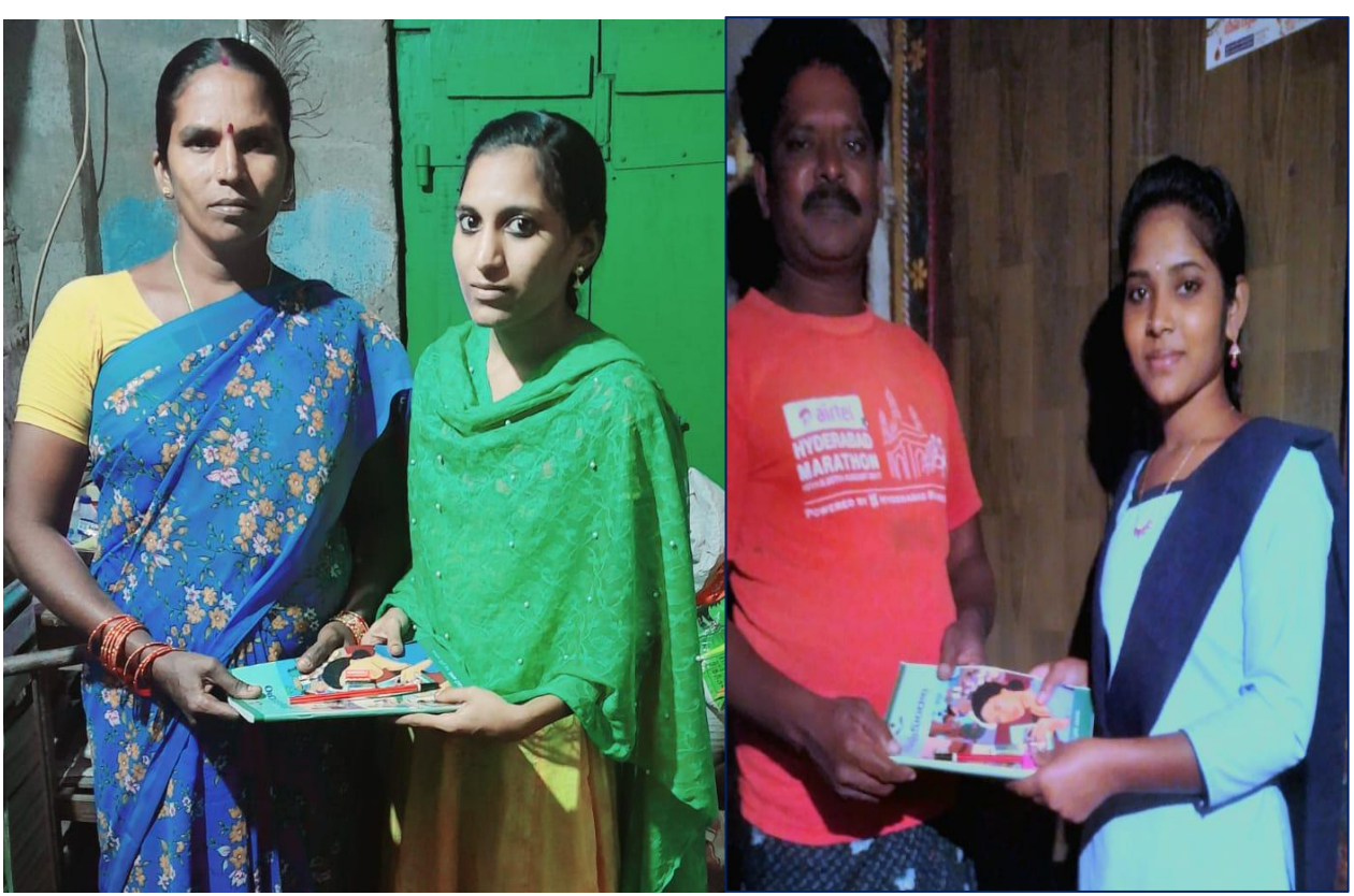
Volunteers teaching adults at their Home